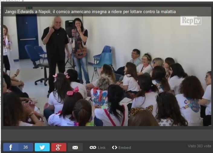
Jango Edwards a Napoli, il comico americano insegna a ridere per lottare contro la malattia